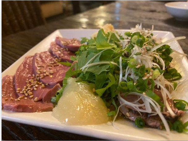
まずは、自慢の日替わり料理 『レバー&ハツの盛り合わせ』