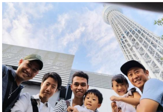
社員とスカイツリーへ見学