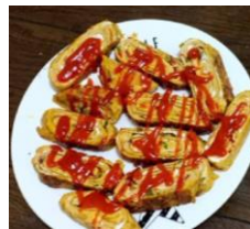
インドネシア風玉焼き