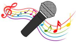
舞台上熱唱！ スモークの演出で 盛り上がります♪