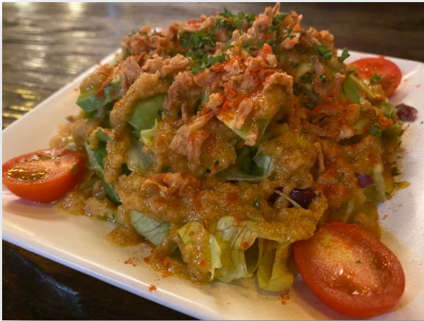
ボリューム満点『ばん菜サラダ』