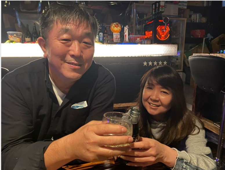
なおみちゃんと 「乾杯♪」