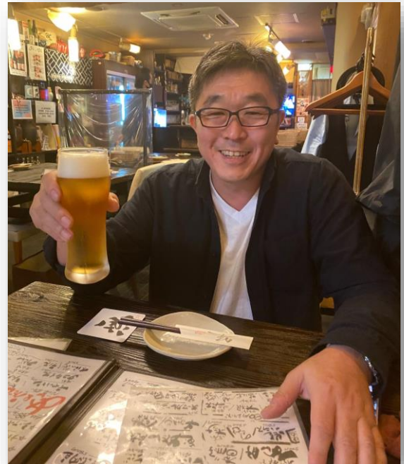
とりあえず、ビールで乾杯♪ 思わず顔がほころびます☆