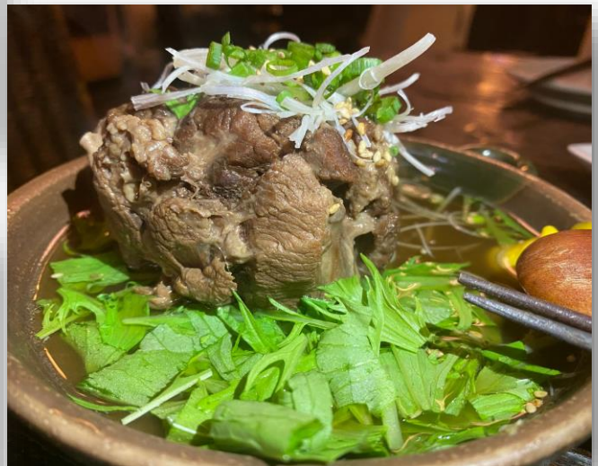
『牛たんの角煮』これは デカイ! が、めっちゃ柔らかい☆