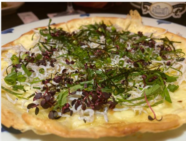
『釜揚げしらすPIZZA!』 クリスピーの薄生地にも、釜揚げしらすと大葉 がなんと絶妙!!これは、旨い♪